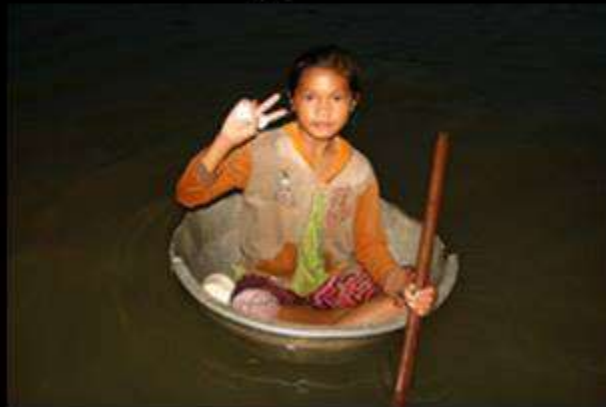
Как видят друзья