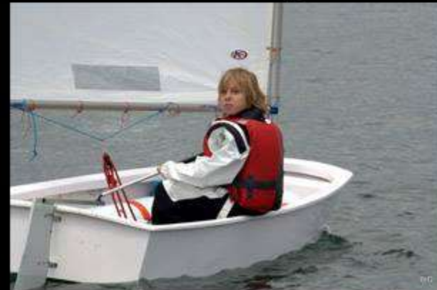
Как на самом деле