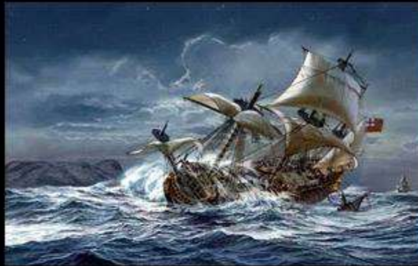
Как видит мама