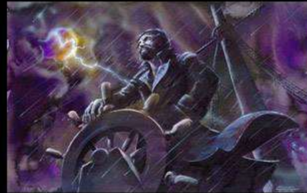
Как вижу я