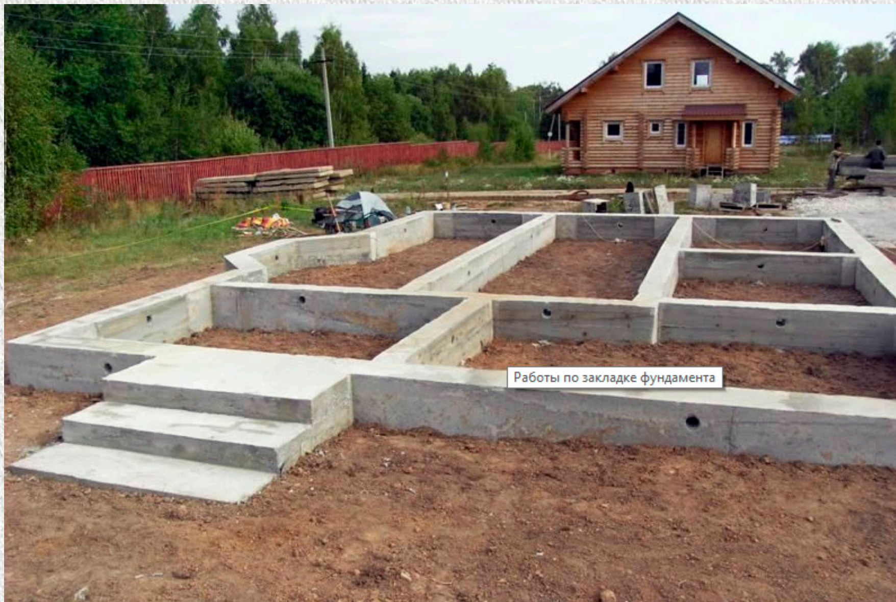
Работы по закладке фундамента